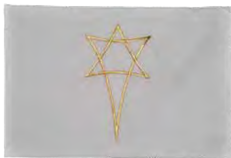
Lesepultrkler for kirkeårets forskjellige faser.

I 2006 begynte vi i Trømborg menighetsråd å jobbe med å anskaffe liturgiske lesepultrkler til Trømborg kirke. Vi hadde en fin lesepult i kirken og vi bestemte oss for å bruke den til å markere skiftningen i vårt kirkeår! Prekestol og alterparti kunne også vært brukt, men det var det ikke noen stemning for.