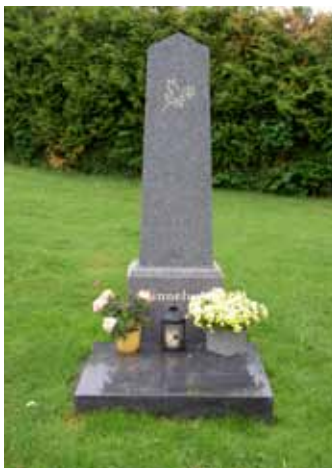
Minnesmerket er en flat obelisk med et due-symbol.

Det er også anledning for alle til å sette blomster foran gravminnet. Noen har familiens gravsted langt unna og har sjelden anledning til å besøke gravstedet. Dette kan være et sted hvor de kan få minnes sine kjære.